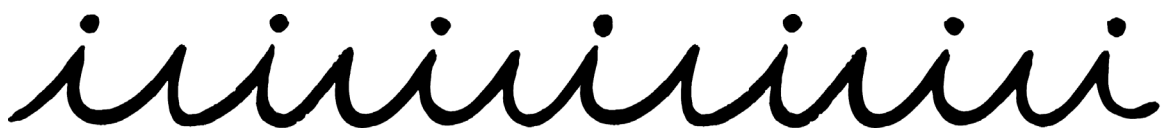
fig.2.) Motif 11 (ongoing)

The four paintings on view try to create a “resistance or tension ... within a larger series of paintings” that Nikolas Gambaroff has been working on in the last three years.